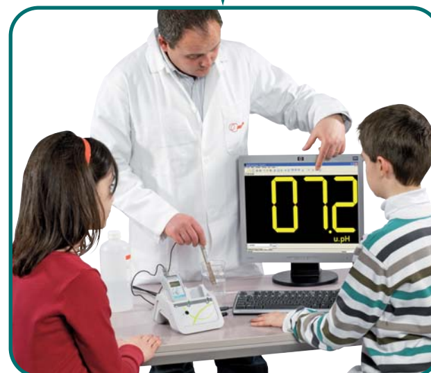
Mesure de pH