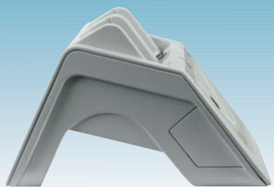
Stabilité et ergonomie