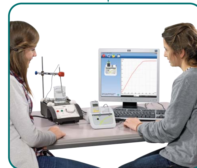
Changement d'état de l'eau : ébullition